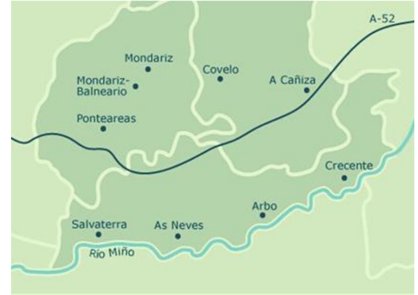
Persoas atendidas no CIM de Ponteareas

O CIM de Ponteareas é o único servizo especializado nas comarcas do Condado e A Paradanta.