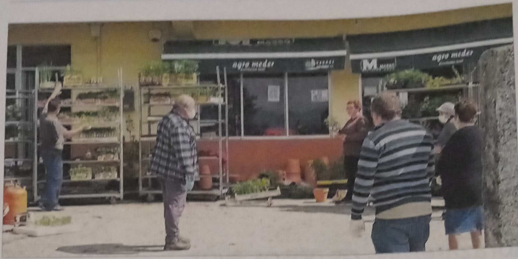
Cientes en una tienda de productos del campo de Meder, en Salvaterra de Miño, ayer por la mañana.