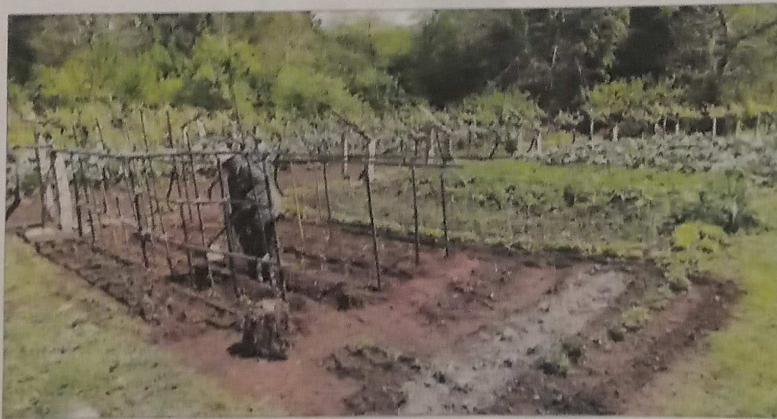
Una mujer trabaja en un huerto en Fiolledo, ayer, en Salvaterra de Miño.

pasando la cuarentena en el campo, a menos de 500 metros de su casa, pero creo que cuando la situación más grave acabe serán muchas más las fincas que se cultiven porque esto nos ha dado una enorme inseguridad", asegura un vecino de Mondariz.